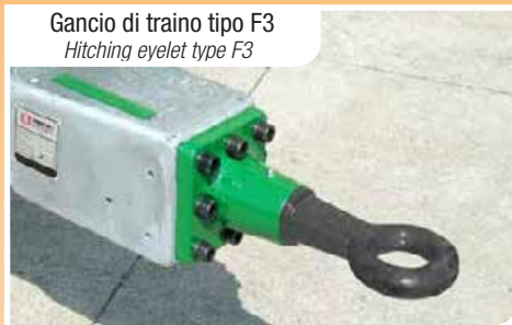
Gancio di traino tipo F3 Hitching eyelet type F3