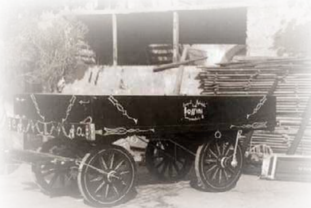
Carro allestito a festa per la partecipazione ad una delle prime fiere agricole. Decorated trailer for the participation in one of the first agricultural fairs.