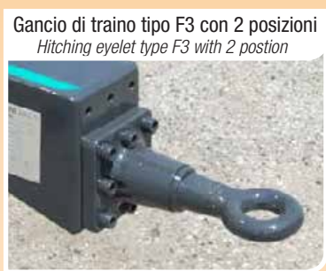
Gancio di traino tipo F3 con 2 posizioni Hitching eyelet type F3 with 2 position