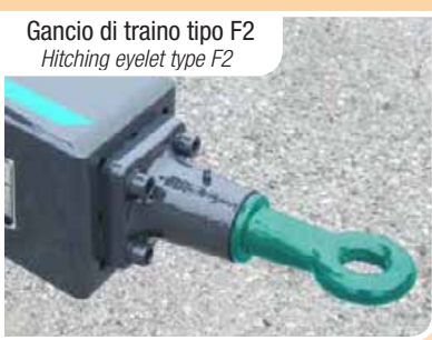
Gancio di traino tipo F2 Hitching eyelet type F2