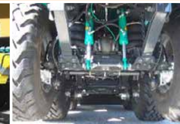
Sollevamento del 1° asse per l'incremento del carico sul gancio di traino, per veicoli a 2 assi Lifting 1st axle to increase the load on the eyelet, for vehicles with 2 axles