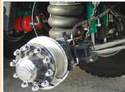
Frenatura a disco con pinza per alte velocità Disc braking with caliper brake for high speed