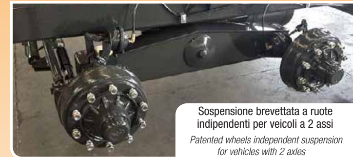
Sospensione brevettata a ruote indipendenti per veicoli a 2 assi Patented wheels independent suspension for vehicles with 2 axles