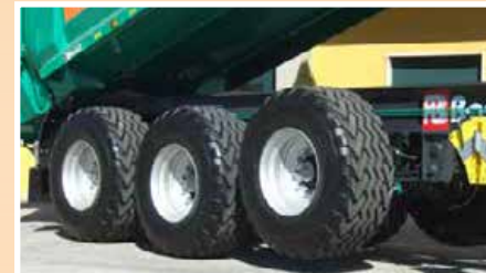
Sollevamento del 1° asse per l'incremento del carico sul gancio di traino, per veicoli a 3 o 4 assi Lifting 1st axle to increase the load on the eyelet, for vehicles with 3 or 4 axles