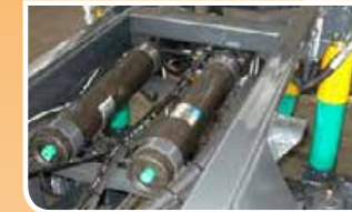
Accumulatori ad azoto a membrana o doppia camera Nitrogen accumulators with membrane or piston-type