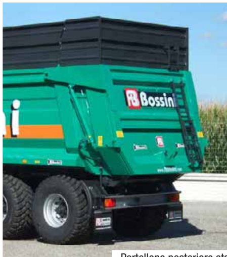
Portellone posteriore standard - Standard rear door