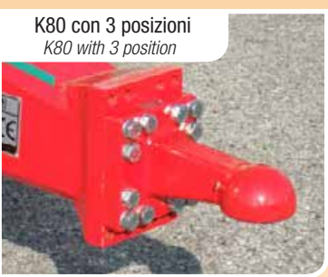
K80 con 3 posizioni K80 with 3 position