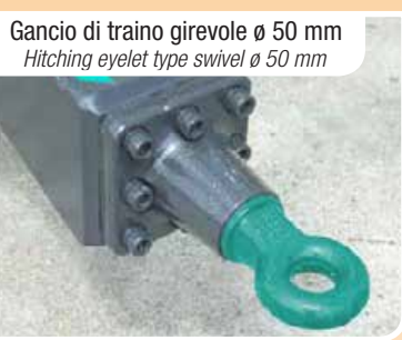
Gancio di traino girevole ø 50 mm Hitching eyelet type swivel ø 50 mm