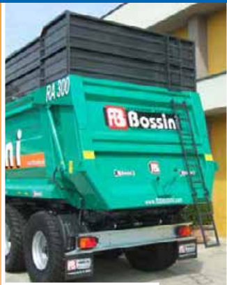
Scaletta posteriore Rear ladder