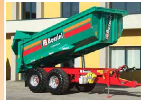
Cassone altezza ribassata e rinforzato per terra o inerti Container height lowered and reinforced for earth or inert materials