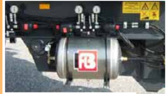
Serbatoio aria in alluminio Aluminium air tank