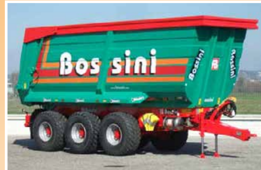
Cassone altezza maggiorata Container height increased