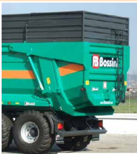
Portellone posteriore maggiorato + cilindri maggiorati Increased rear door with capacity + increased cylinders