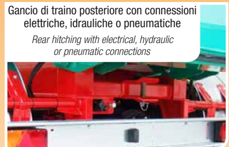
Gancio di traino posteriore con connessioni elettriche, idrauliche o pneumatiche Rear hitching with electrical, hydraulic or pneumatic connections