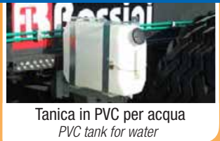
Tanica in PVC per acqua PVC tank for water