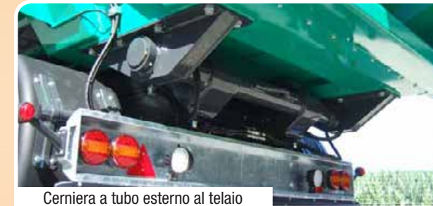
Cerniera a tubo esterno al telaio Tubular hinge outside the chassis