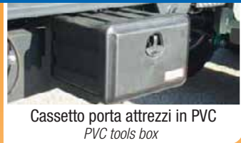
Cassetto porta attrezzi in PVC PVC tools box