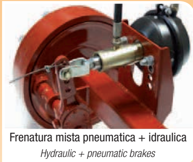
Frenatura mista pneumatica + idraulica Hydraulic + pneumatic brakes