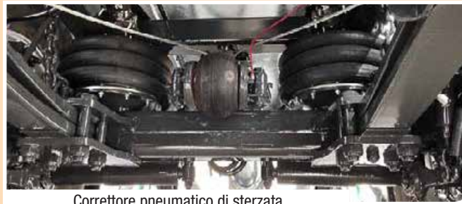
Correttore pneumatico di sterzata Pneumatic steering corrector