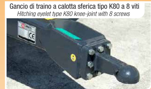
Gancio di traino a calotta sferica tipo K80 a 8 viti Hitching eyelet type K80 knee-joint with 8 screws