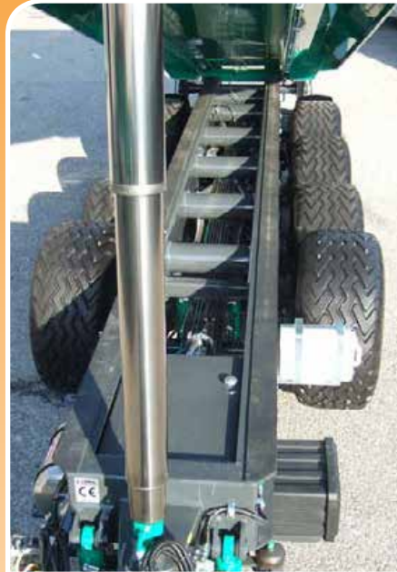
Telaio in trave industriale con traverse di irrigidimento a sezione circolare Industrial chassis reinforced with tubes of circular section

Patented hydraulic suspension with new torpress 3 sectors with rings and multilayer membrane for heavy use. New connecting pipes increased ø 65 mm. Patent Nr. 5199A/89