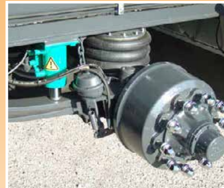
Stabilizzatori idraulici posteriori Hydraulic rear stabilizer cylinders