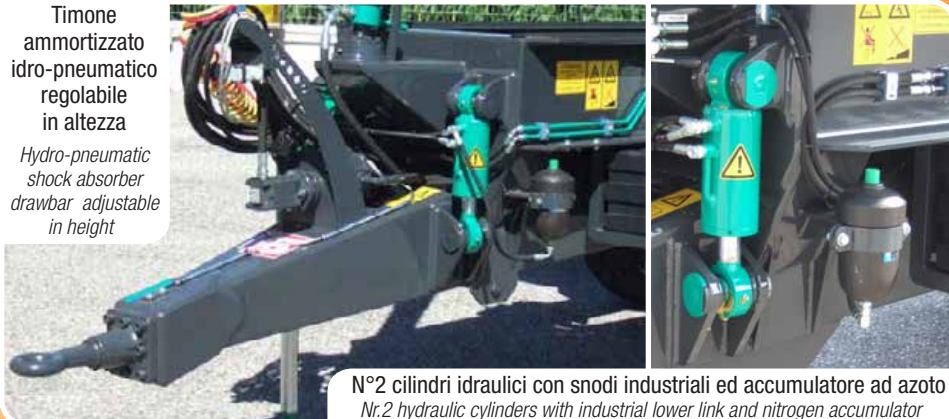
N°2 cilindri idraulici con snodi industriali ed accumulatore ad azoto Nr.2 hydraulic cylinders with industrial lower link and nitrogen accumulator

Timone ammortizzato idro-pneumatico regolabile in altezza Hydro-pneumatic shock absorber drawbar adjustable in height