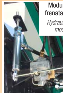
Modulatore di frenata idraulico Hydraulic braking modulator