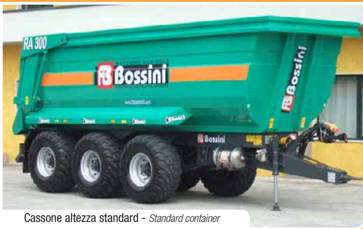
Cassone altezza standard - Standard container