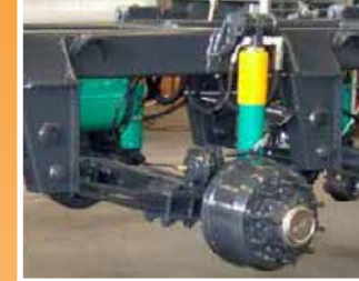
Sospensione oleodinamica con cilindri idraulici doppio effetto Oleodynamic suspension with double-acting hydraulic cylinders