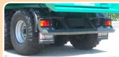
Barra posteriore antincastro Rear bumper reinforced