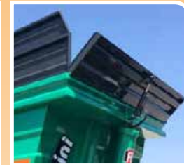
Soprasponda anteriore 50 cm ribaltabile idraulica Hydraulic anterior extension side 50 cm