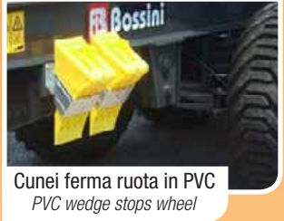
Cunei ferma ruota in PVC PVC wedge stops wheel