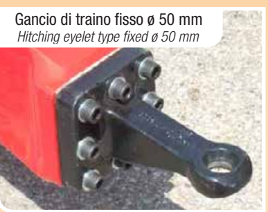
Gancio di traino fisso ø 50 mm Hitching eyelet type fixed ø 50 mm