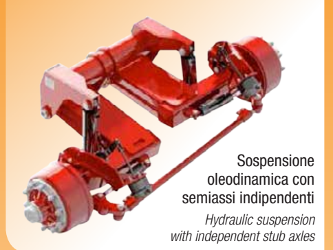
Sospensione oleodinamica con semiassi indipendenti Hydraulic suspension with independent stub axles