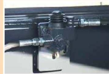
Valvola di sicurezza contro l'apertura accidentale del portellone Safety valve against accidental opening of the rear door