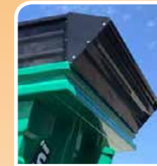
Soprasponda anteriore inclinata a 45° Anterior extension side inclined at 45°