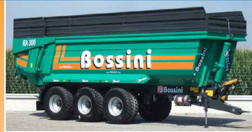
Cassone altezza standard +soprasponde 50+35 cm Standard container with extension sides 50+35 cm