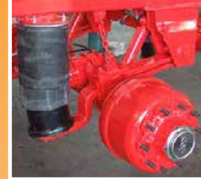
Sospensione pneumatica con diapress e semibalestra tipo Z Air suspension with diapress and spring type Z