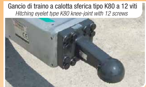
Gancio di traino a calotta sferica tipo K80 a 12 viti Hitching eyelet type K80 knee-joint with 12 screws