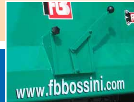
Bocchetta per scarico cereali Rear opening for unloading cereals