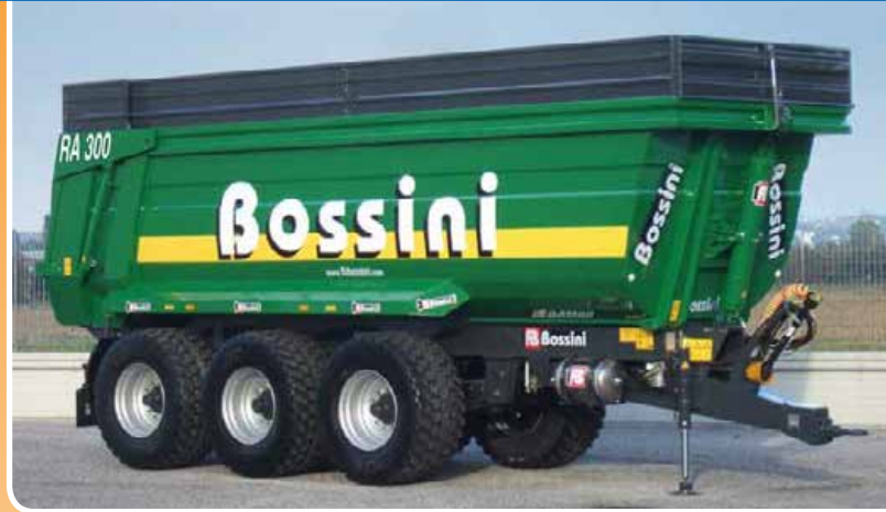
Cassone altezza standard +soprasponde 50 cm Standard container with extension sides 50 cm