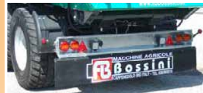
Barra posteriore con doppi fanali a LED e fari lavoro + para spruzzo industriale Rear bar with dual LED and working lights + industrial anti sprav