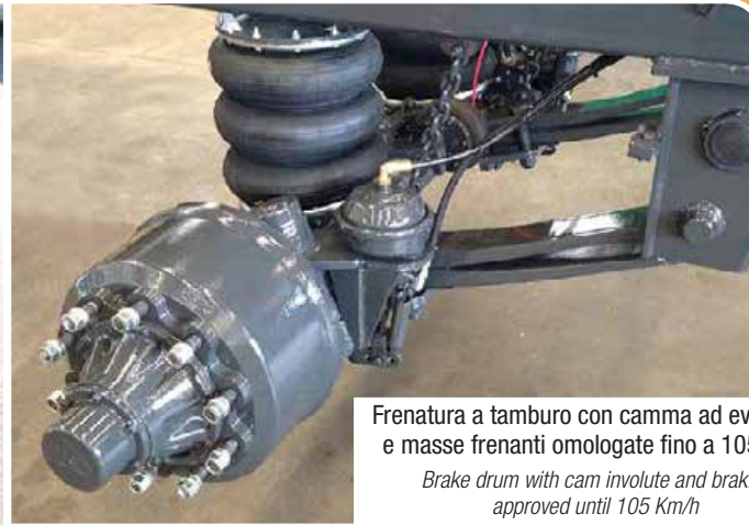
Frenatura a tamburo con camma ad evolvente e masse frenanti omologate fino a 105 Km/h Brake drum with cam involute and braking approved until 105 Km/h