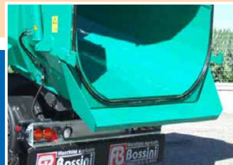
Bavero posteriore - Rear chute