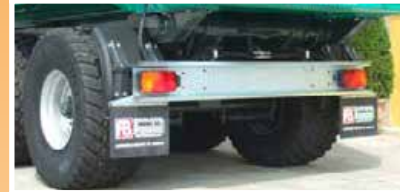
Barra posteriore con fanali standard Rear bar with standard lights