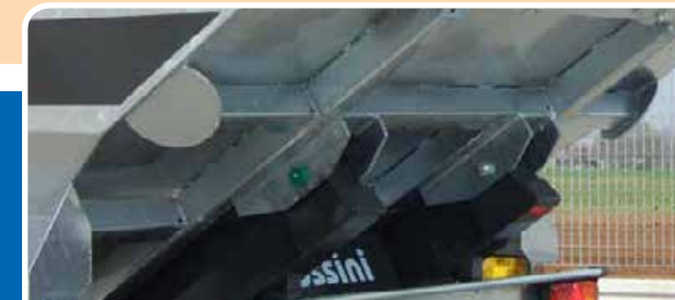
Cerniera a perno sul telaio - Pin hinge on the chassis