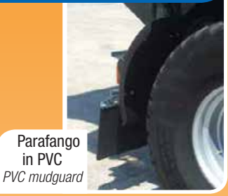
Parafango in PVC PVC mudguard